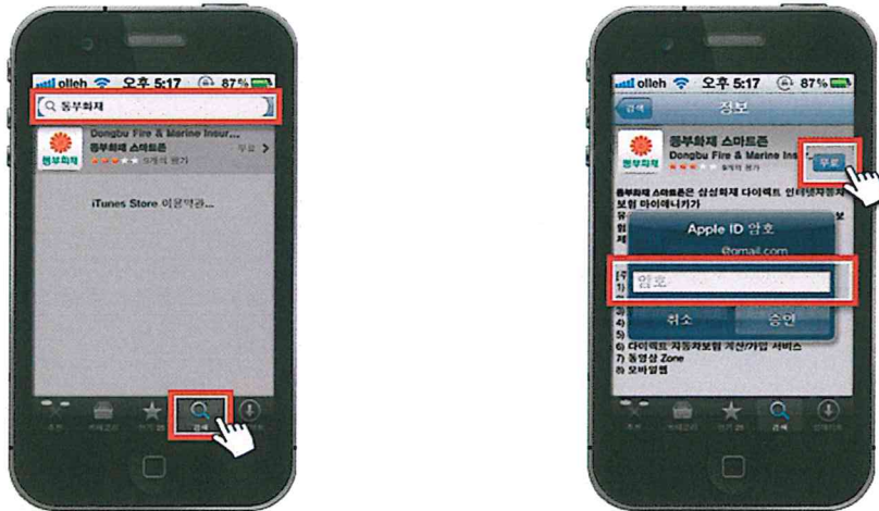
01 App스토어 실행 후 동부화재 검색